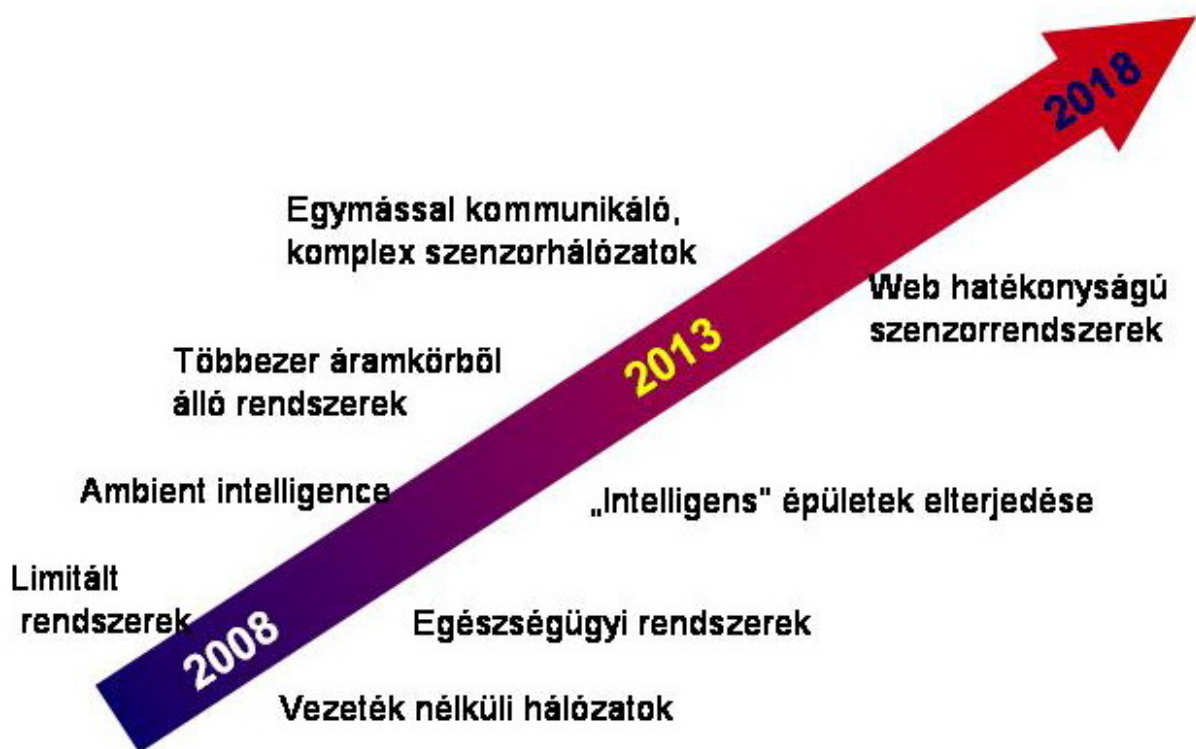
1. ábra: 2008-2018

A vizsgált periódus második felében megjelennek az önmagukat telepítő hálózatok is. A hely-érzékes szenzorok a web méretét és hatékonyságát megközelítő/elérő alkalmazásokban valósidejű megfigyeléseket és méréseket szolgáltatnak a világról. Hálózataik mind gyakrabban funkcionálnak adatbázisokként is.